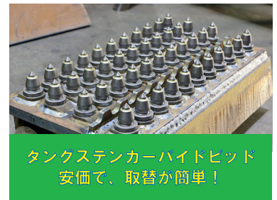
タングステンカーバイドビット 安価で、取替が簡単！